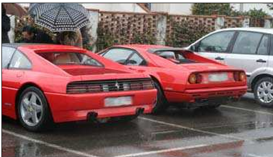
FERRARI SOTTO LA PIOGGIA

Diciamo la verità: noi la primavera l'abbiamo aspettata, è lei che non si è proprio fatta vedere visto che Domenica 13 Marzo è stata una giornata di pioggia fitta ed insistente e di freddo. Comunque i soci del nostro club non sono tipi che si fermano davanti a questo genere di contrattempi e si sono presentati numerosi all'appuntamento. La gita ha avuto come meta l'abbazia di Morimondo, luogo di preghiera e di meditazione, che è stata invasa dalla carovana delle nostre vetture. Chissà se l'abate Gualchezio (Gualguerus), fondatore dell'abbazia nel lontano 1134, avrebbe mai pensato che invece di penitenti stanchi del lungo cammino e di pellegrini in cerca di indulgenze, alla porta del monastero avrebbero bussato i soci di una diversa confraternita, quella degli amanti delle vetture d'epoca. Comunque a ben pensarci qualche tratto in comune fra noi ed i monaci cistercensi c'è: anche noi, come loro facevano con i libri, cerchiamo di conservare la memoria (automobilistica) del passato per tramandarla nel tempo. Certo noi non ci sottoponiamo alle stesse