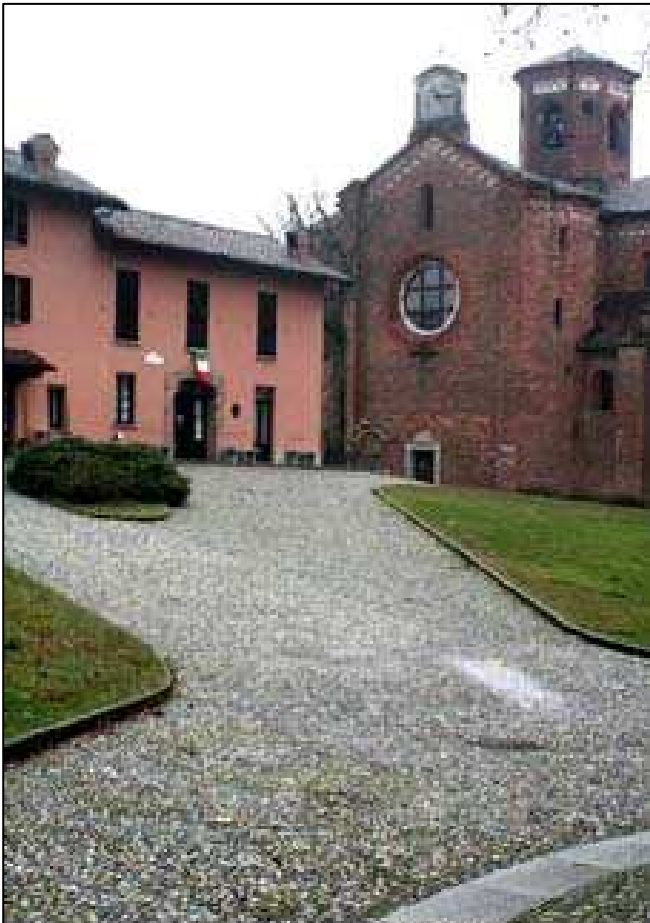
IL BORGO DI MORIMONDO

Diciamo la verità: noi la primavera l'abbiamo aspettata, è lei che non si è proprio fatta vedere visto che Domenica 13 Marzo è stata una giornata di pioggia fitta ed insistente e di freddo. Comunque i soci del nostro club non sono tipi che si fermano davanti a questo genere di contrattempi e si sono presentati numerosi all'appuntamento. La gita ha avuto come meta l'abbazia di Morimondo, luogo di preghiera e di meditazione, che è stata invasa dalla carovana delle nostre vetture. Chissà se l'abate Gualchezio (Gualguerus), fondatore dell'abbazia nel lontano 1134, avrebbe mai pensato che invece di penitenti stanchi del lungo cammino e di pellegrini in cerca di indulgenze, alla porta del monastero avrebbero bussato i soci di una diversa confraternita, quella degli amanti delle vetture d'epoca. Comunque a ben pensarci qualche tratto in comune fra noi ed i monaci cistercensi c'è: anche noi, come loro facevano con i libri, cerchiamo di conservare la memoria (automobilistica) del passato per tramandarla nel tempo. Certo noi non ci sottoponiamo alle stesse